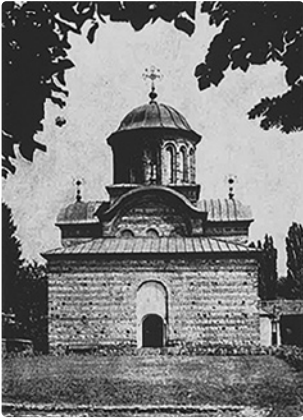
↑ Curtea de Argeș